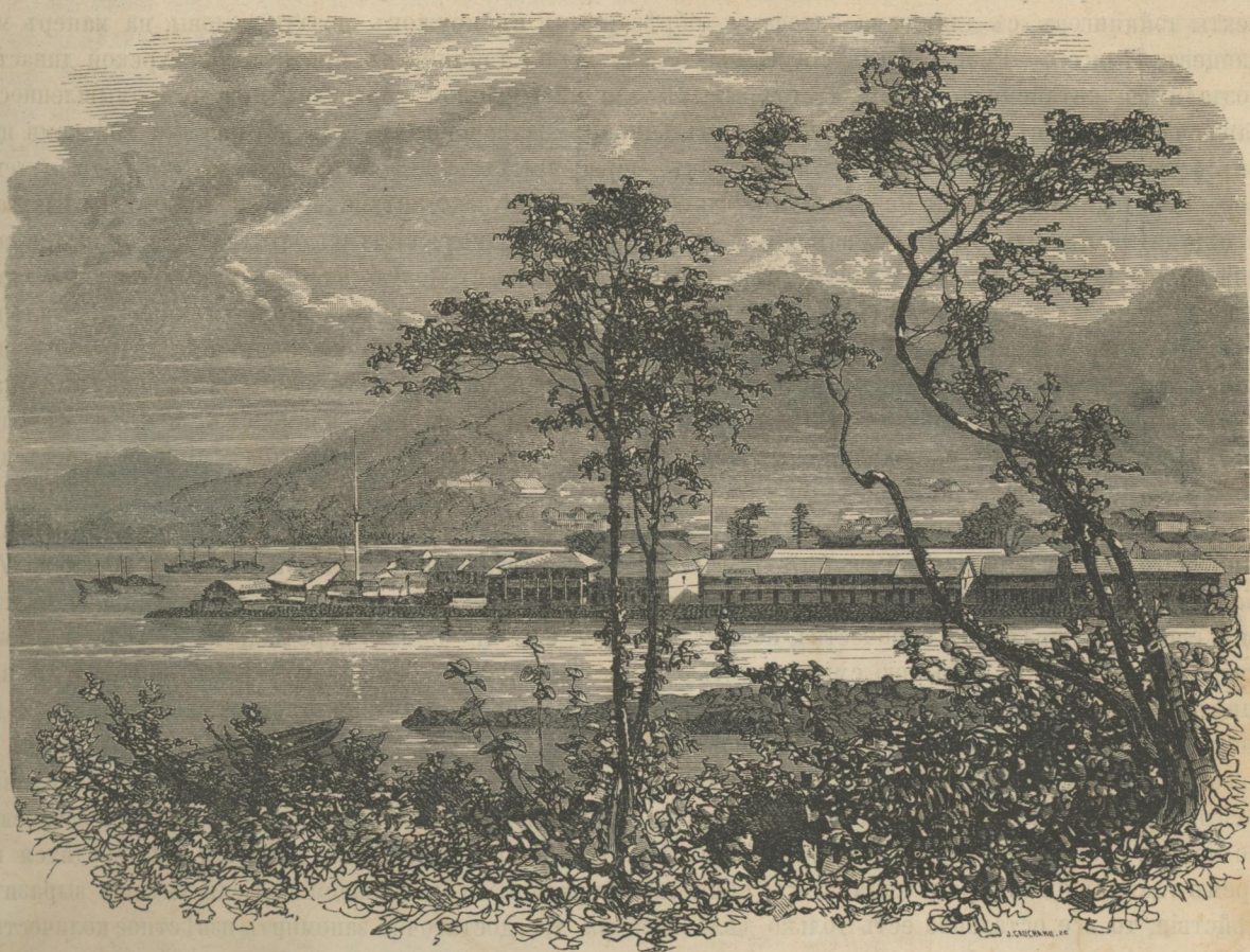
Видъ города Децима.

Наконецъ монбанъ обязанъ самъ дѣлать ночные обходы кругомъ домовъ по два раза въ часъ, по всѣмъ аллеямъ и между террасами находящимися въ саду; иногда онъ поручаетъ это своимъ помощникамъ, за которыхъ, впрочемъ, всегда отвѣчаетъ самъ. Дѣлающій обходъ даетъ знать о своемъ присутствіи тремя ударами — однимъ продолжительнымъ и двумя короткими, ударяя одинъ о другой два четырехгранные бруска. Въ случаѣ опасности онъ долженъ бить тревогу посредствомъ частыхъ ударовъ въ гонгъ. Вдоль южной стороны забора тянется цѣлый рядъ жилищъ, дворовъ и разныхъ построекъ, тщательно скрытыхъ за густыми деревьями. Прежде всего вы видите прачешную, которою заправляетъ китайскій бѣлизчикъ, затѣмъ идутъ конюшни, а про-