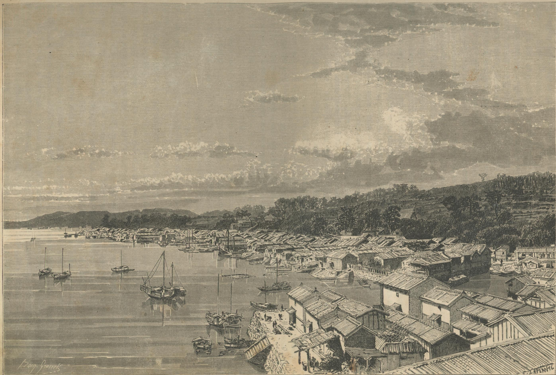
Видъ пролива Ванъ-деръ-Капеленъ и города Симонозеки.