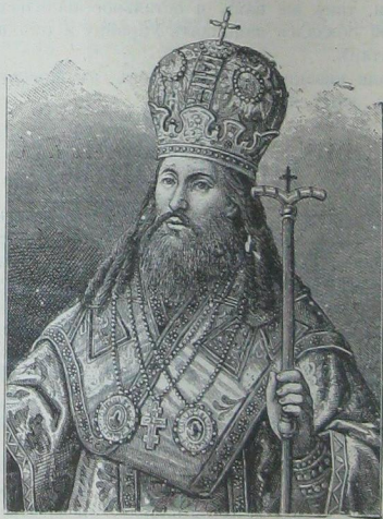
Никонъ, патріархъ московскій и всея Россіи.

именемъ Никона. Слава его подвижнической жизни пошла далеко. Заслуги его были такъ велики, что его скоро сдѣлали игуменомъ этого монастыря. По обычаю того времени, онъ долженъ былъ явиться въ Москву, представиться царю Алексѣю Михайловичу. Его умъ, рѣшительная рѣчь и начитанность понравились царю, и онъ