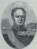
Императоръ Александръ I.

Когда главныя силы французовъ двинулись по направлению къ Москвѣ, эти арміи не рѣшились дать Наполеону сраженіе, а стали шагъ за шагомъ отступать къ Смоленску, гдѣ и соединились. Наполеонъ двинулся за ними: онъ рассчитывалъ отрѣзать русскую армію отъ Москвы, напавъ на нее съ тылу. Однако, это ему не удалось. Корпусъ Раевского успѣлъ занять Смоленскъ въ то время, какъ Невѣровскій съ семью тысячами храбрыхъ сдерживалъ подъ селомъ Краснымъ стотысячную армію Наполеона. Раевскій безъ устали двое сутокъ отстаивалъ Смоленскъ, пока, наконецъ, не