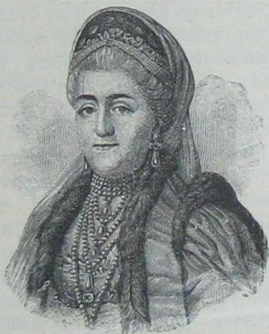
Императрица Екаатерина II.

Среди всѣхъ этихъ внѣшнихъ дѣлъ императрица постоянно заботилась о внутреннемъ управленіи государ-