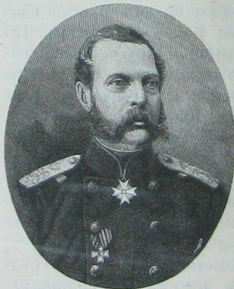
Императоръ Александръ II.

съ его плодородными теплыми долинами, нетронутыми лѣсами и неразработанными минеральными богатствами. Впродолженіе 50 лѣтъ тянулась безуспѣшная борьба. Наконецъ, послѣ окончанія Крымской войны, императоръ Александръ II рѣшилъ усмирить эти воинственные племена и покончить войну, которая стоила много крови. Въ это время во главѣ горцевъ стоялъ воинственный и умный начальникъ — Шамиль. Онъ былъ ихъ главнымъ духовнымъ лицомъ и имѣлъ большую власть. Императоръ