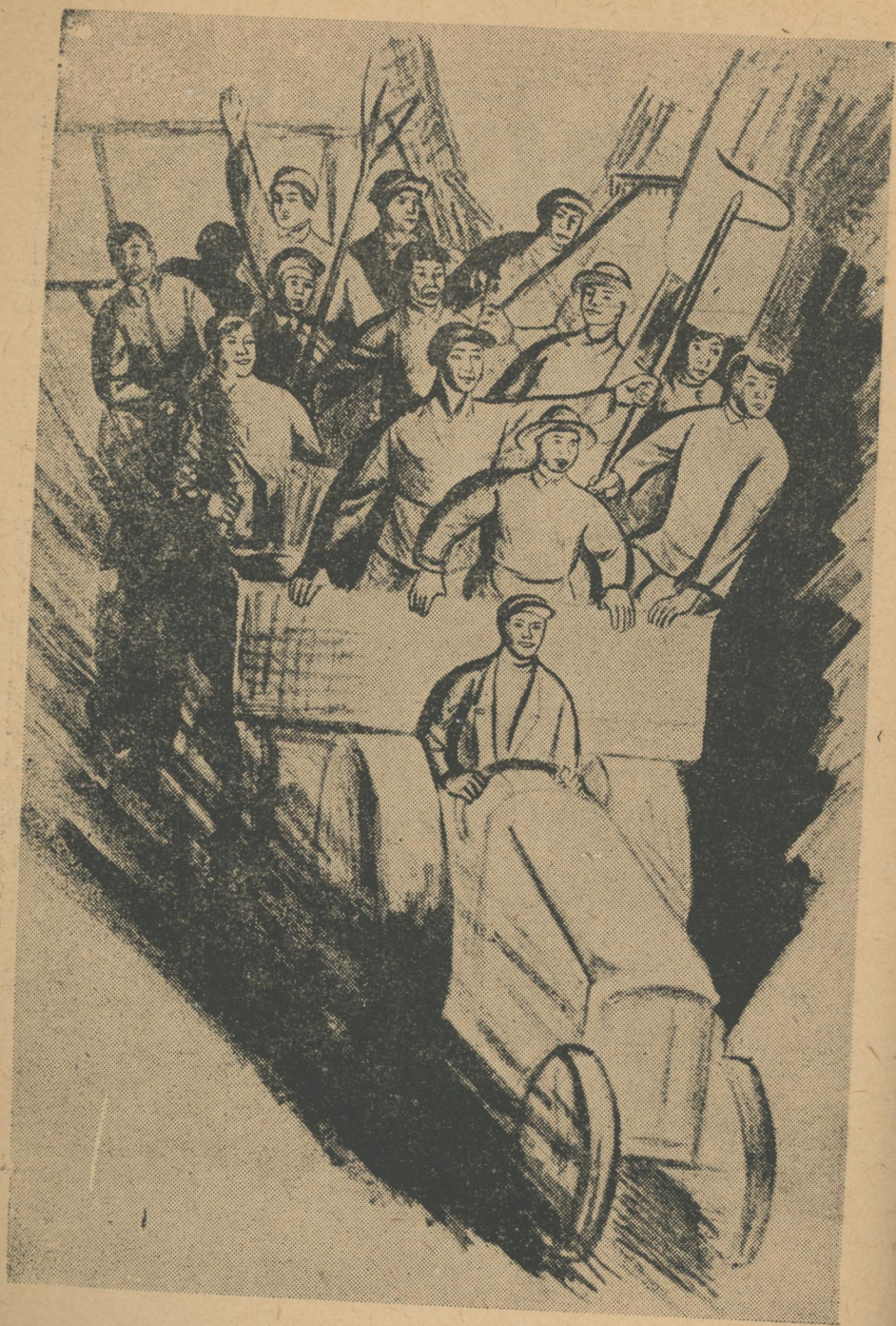
Комсомол — на колгоспні поля

А. ПИСАРЬКОВ (Київський інститут пролетарського мистецтва)