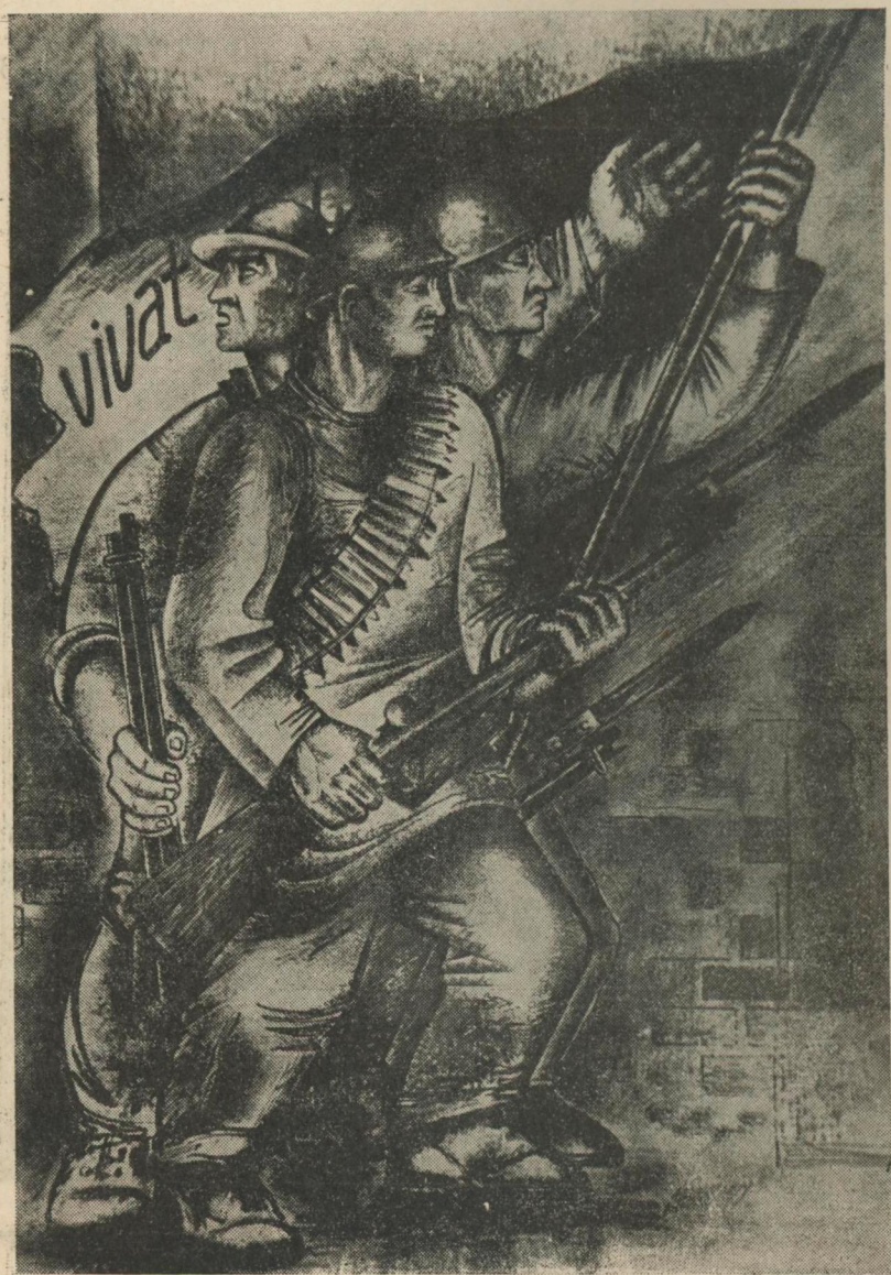
ФРАГМЕНТ ДО КАРТИНИ „ПРОЛЕТАРІЯТ ЗАХОДУ“