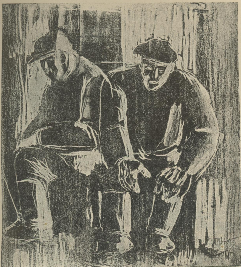
М. ГЛУЩЕНКО „Безробіття на Заході“