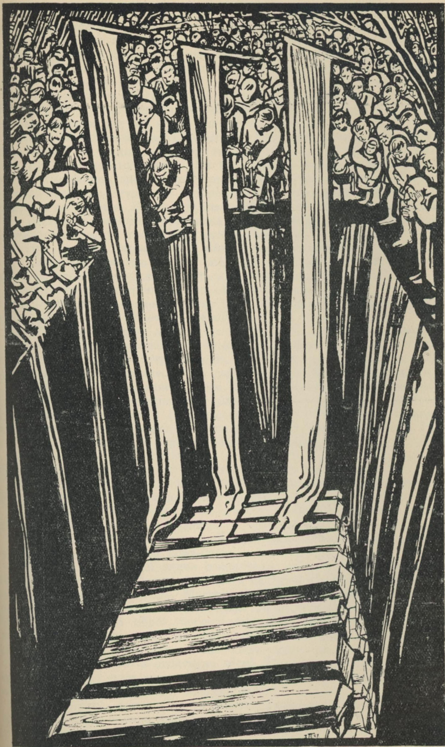
На братній могилі (1928 р.)