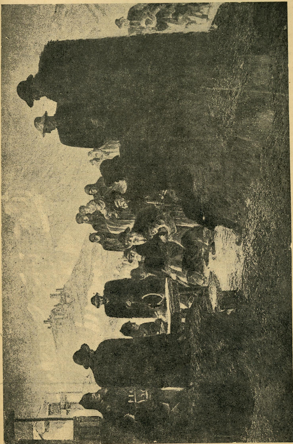
Відпускник червоноармієць встановлює радіо в гірському аулі Сванетії