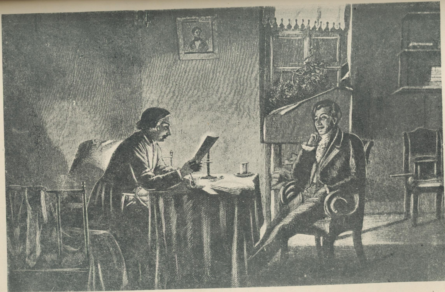
„3 грудня 1833 р.—Вчора Гоголь читав мені казку“ „Як Ів. Ів. посварився з Ів. Тимоф. (Никифоровичем),—дуже, оригінально і дуже смішно“ Пушкін щоденник.