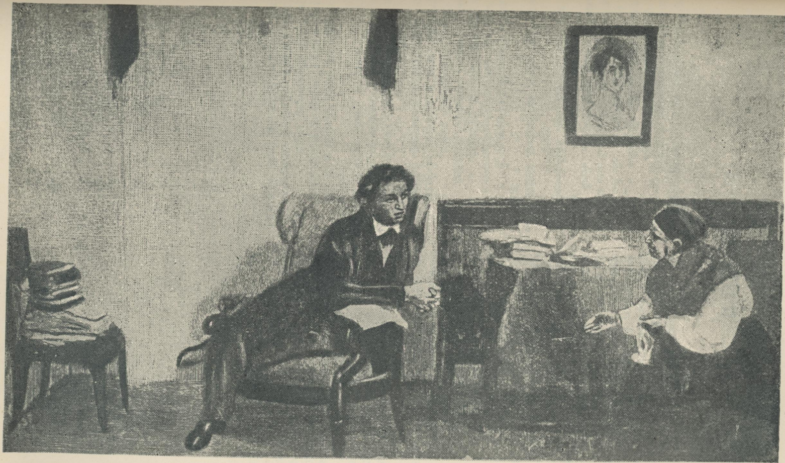
Пушкін і няня.