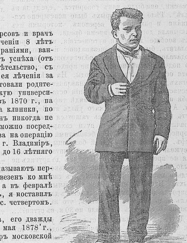
Рис. 4. Снять тамъ-же, 12 іюля 1878 года.

Въ настоящее время нахожусь въ Харьковѣ: Екатерининск. ул., гостин. „СТАРѢ БЕЛВЮ“, и пробуду до 18-го числа сего мѣсяца.