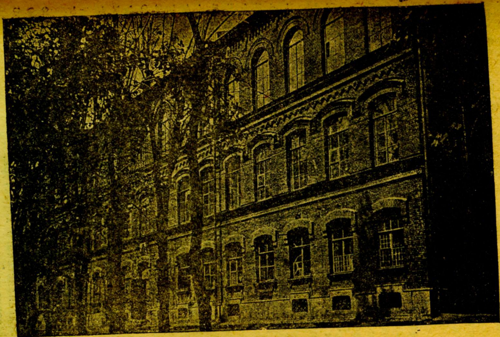
Химический корпус Химико-технологического института