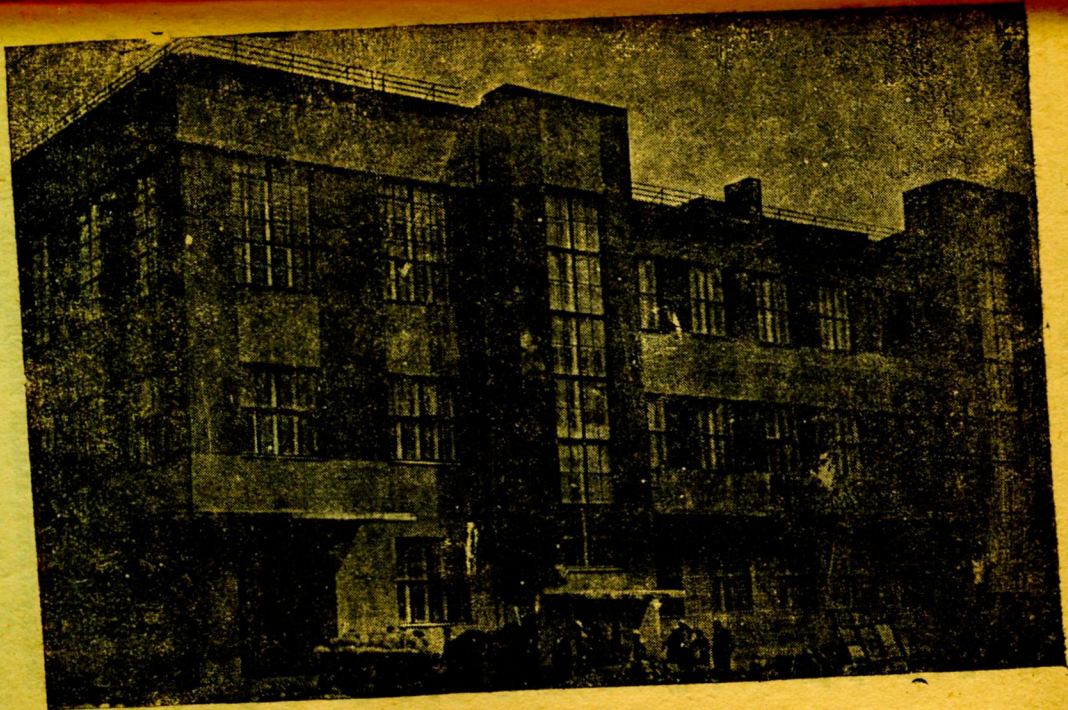
Институт силикатов. Юмовская ул.