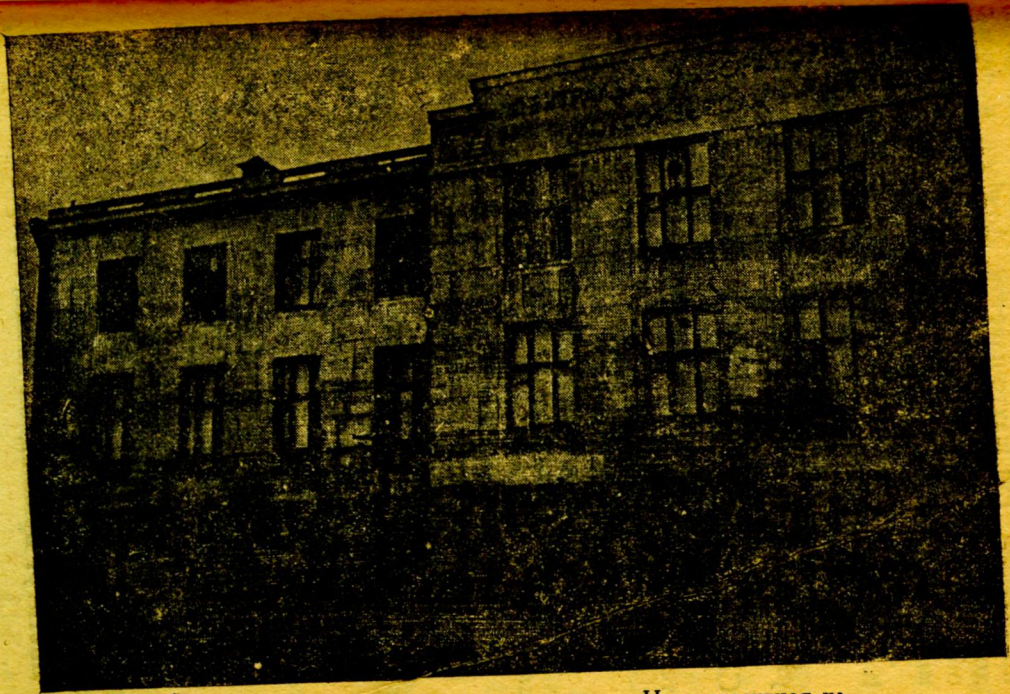
Лаборатории Углекислотного института. Ново-проектная ул.