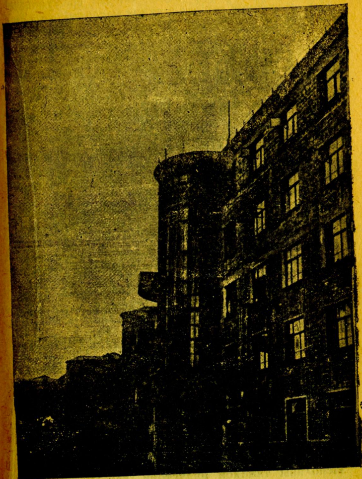
Дом пролетарского студенчества. Пушкинская ул.