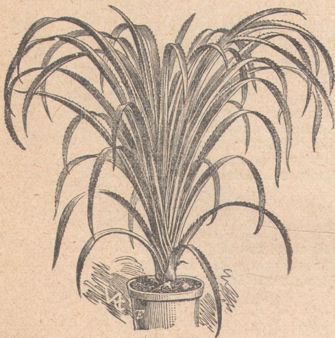
7305. Панданус утилис.

Зовется еще — „Тонкий финик“. Листья почти прямые, почти без изгиба. Листочки узко-ланцетные, распределены на главном стержне на равном расстоянии друг от друга, снизу зеленые, голые. Красивый вид пальмы.