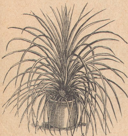
6693. Драцена индивиза.