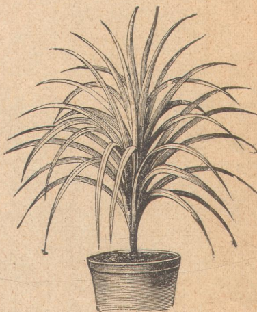
6690. Драцена аустралис.