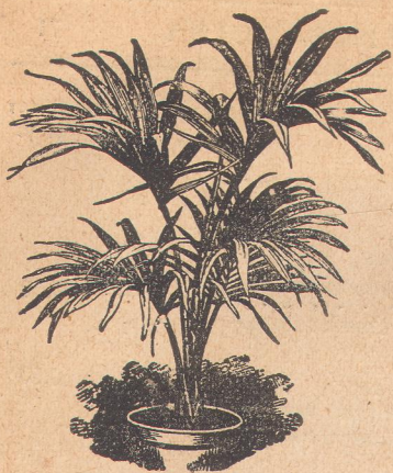
7020. Кентия форстериана.