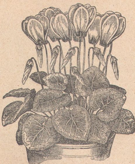
6840. Цикламен персикум.