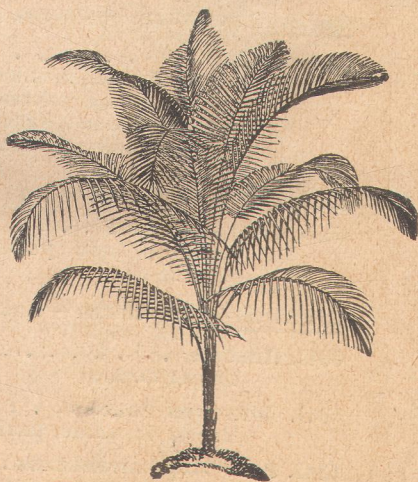
7022. Кокос ведделиана.