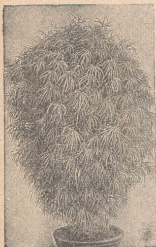
5525. Кохиа трихофилла.