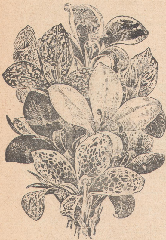
5501. Канна Крози.