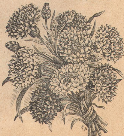
4820. Центауреа цианус—махровый.