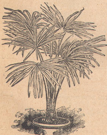
7015. Корифа аустралис.