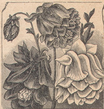
6210. Аквилегия махровая.