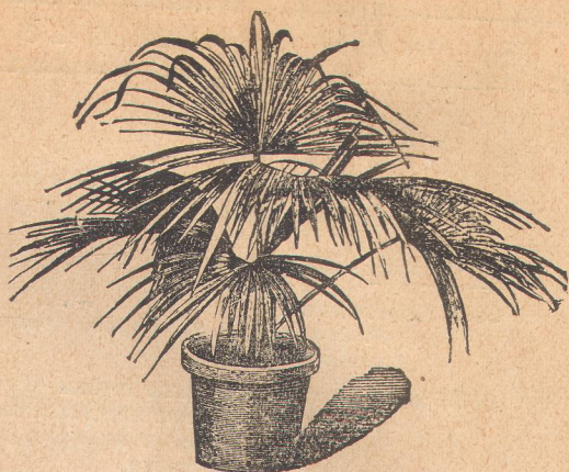
7023. Латания борбоника.