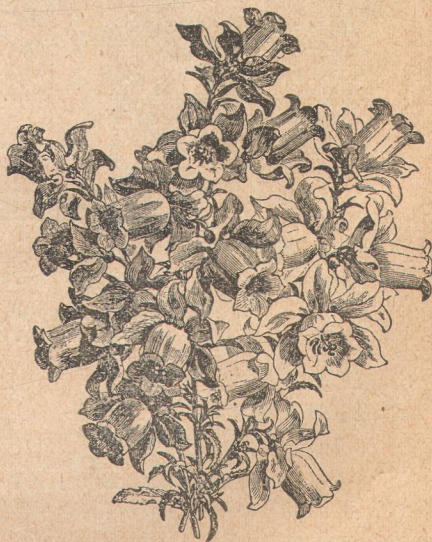
6285. Кампанула медиум.