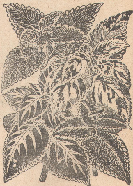
5515. Колеус гибридный.