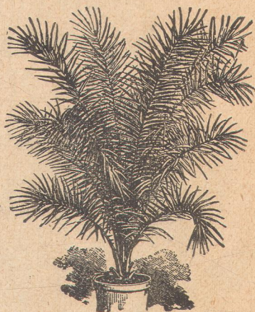
7048. Феникс канариензис.