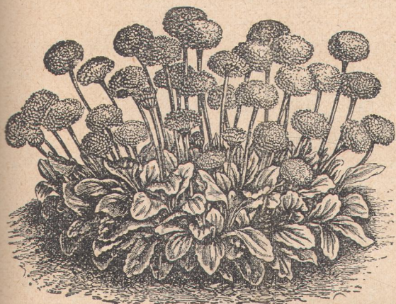
6405. Беллис переннис — Снежный шар.