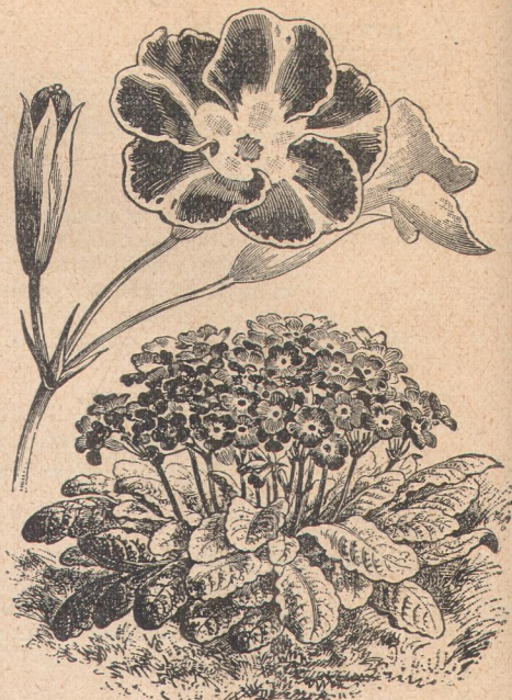
6540. Примула верис. ✕