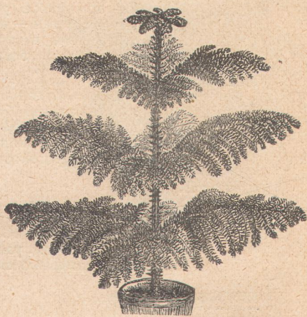
7002. Араукария эксцельза.

7049. Реклината . . . . . 10 зерен — 0.25 — — —