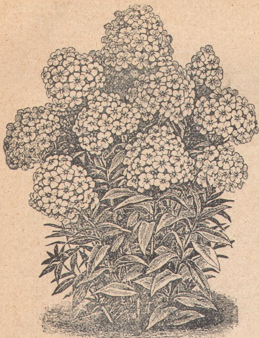
6565. Флокс многолетний.