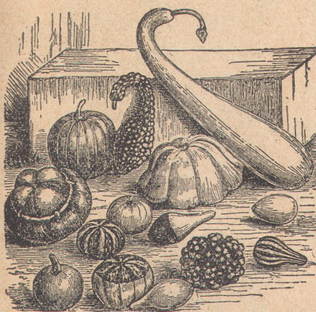
5930. Тыквы фигурные.