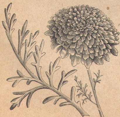
4795. Хризантема садовая.