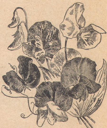
5968. Горошек душистый.