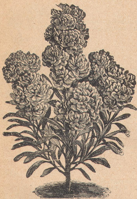
4345. Левкои Дрезденские.