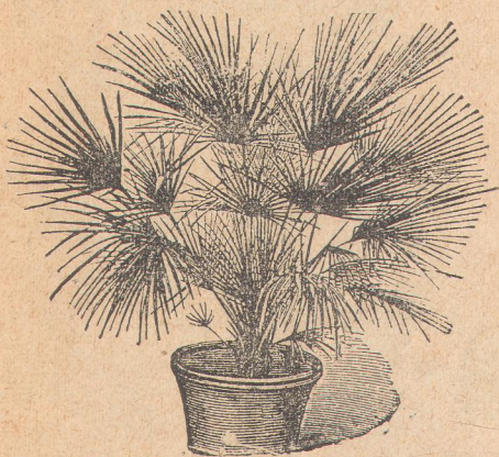
7060. Хамеропс эксцельзус.