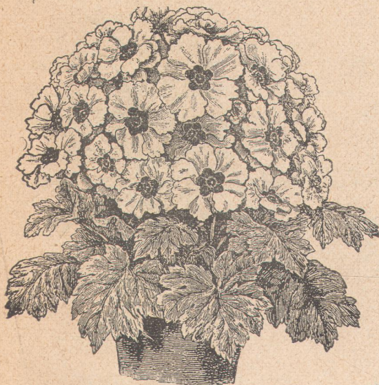
6811. Примула хинензис фимбриата .

Цветы красивые, оригинальной формы, крупные. При посеве в марте зацветает к осени, при посеве в июле—весною. Красивое оранжевое и комнатное растение.