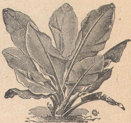
6730. Муза энзете .