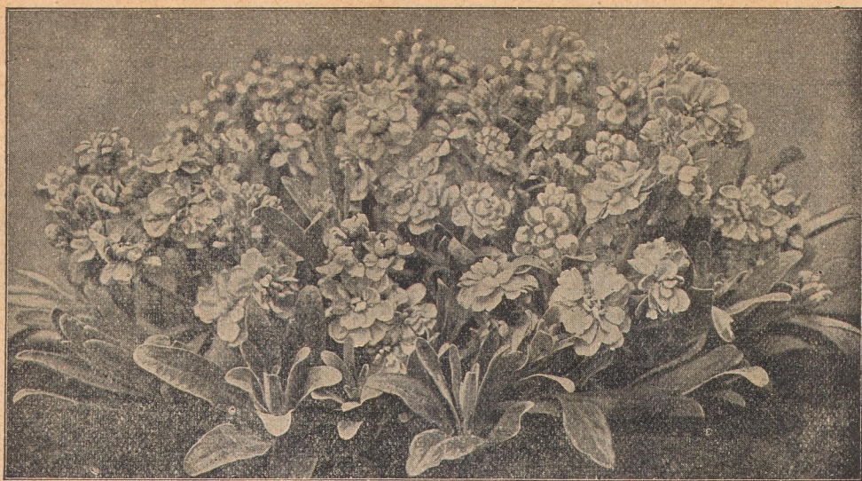
4376. Левкои карликовые.