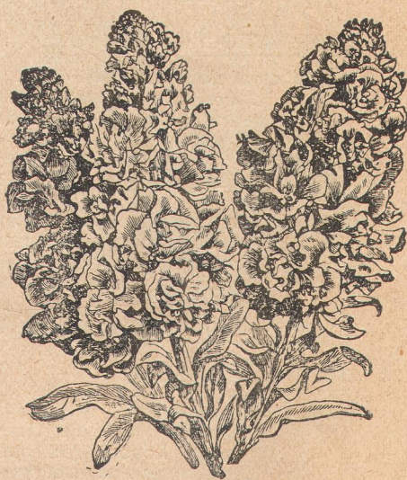
4291. Лак фиоль махровый.