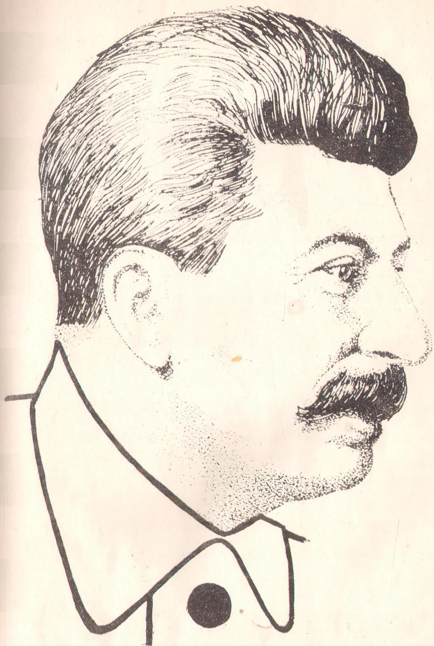
Й. В. СТАЛІН