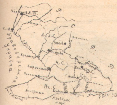
Мал. 1. Мапа ботаніко-географічних районів Лівобережжя України—Лавренка. З'ясування скорочень: Л. П. — лівобережне Полісся, Л. Л.-С.—лівобережний лісостеп, Ч. С. — чорноземельний степ, Нч. С. — надчорноморський степ, Д. С. — Донецький степ. Межі районів позначені рисочками, межі губерніяльні — пунктиром.