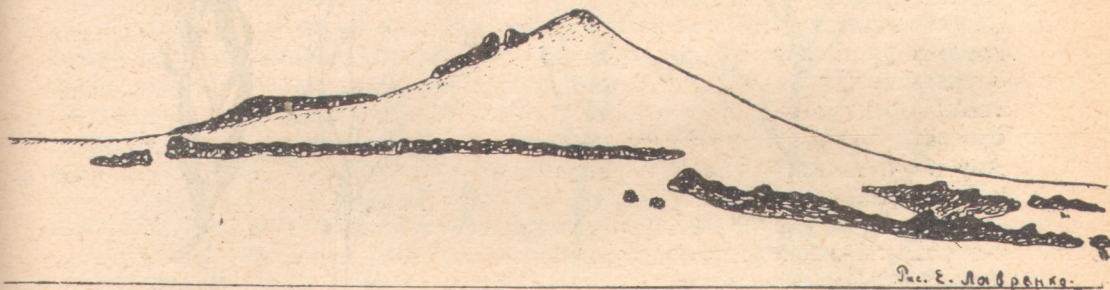
Мал. 3. Гора Савур-Могила на сході Донеччини (Таганрогська округа).