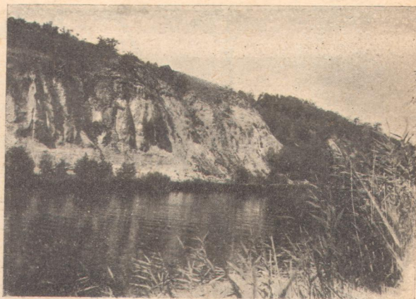
Мал. 2. Козача Гора. Круча правого берегу р. Донця біля Коробових Хуторів на Харківщині.