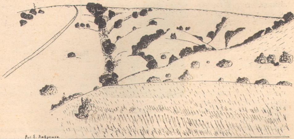
Мал. 4. Балочка на правому схилі долини р. Кринки, в околицях сл. Олександрівки. Деревя та кущі по балці та розгалуженням її. Останні ліски на правобережжі р. Кринки.