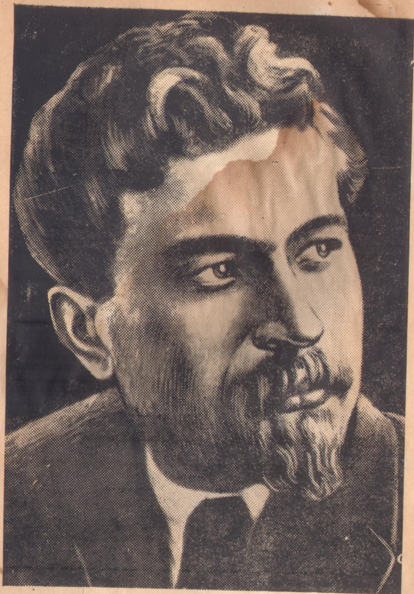
П. П. ЛЮБЧЕНКО Секретар ЦК КП(б)У