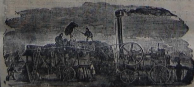
Лучшіе въ мірѣ паровыя молотильныя машинны