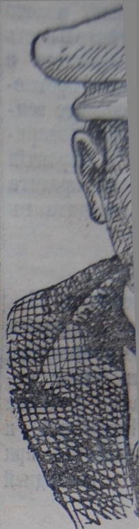
Бывшій начальникъ К

По ходатайству прокурора судъ оглашаетъ приговоръ харьковской судебной палаты по дѣлу по обвиненію Мищука