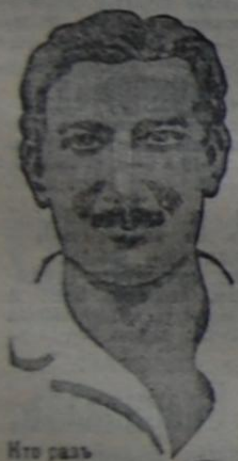
Кто разъ принимаетъ

Единственные представители для Харьковской, Полтавской, Воронежской и Курской губ.: Телемеханика К-ра Артели Русскихъ Инженеровъ, Харьковъ, Патронскій пер., 18.