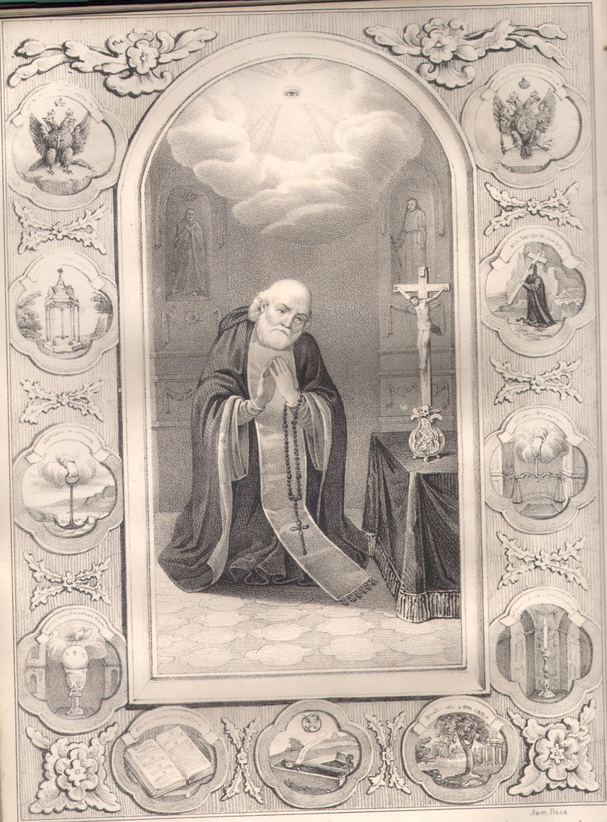
Рис. на камнѣ Шмидт