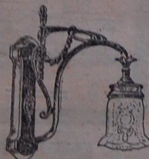
„Бригитта“ на 60 свѣч. освѣщ. „Симпироль“ расходуетъ „всего 1/2 л. въ часъ.

Освѣщеніе воздушнымъ газомъ „СИМПИТРОЛЬ“.