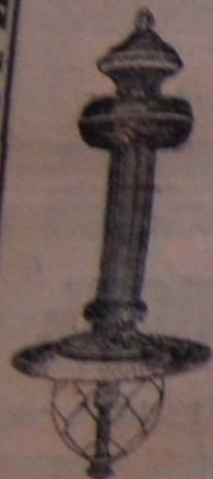
Фонарь „Комета“ 780—1200 свѣч.