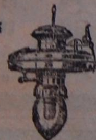
„ПРОМЕТЬ“ для внутр. освѣщ. 140 св. 1 л. въ часъ. Цѣна руб. 19.00

Заказы исполн. почтой нал. плат. въ Си- бирь и Азіатск. Россію по получ. задатка 1/2 стоимости заказа.