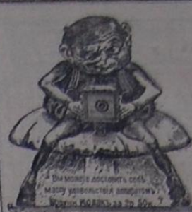
ФОТО- НОВОСТИ приближают каждого ВСЕ для любителей, для профессионалов Фото-принадлеж лучших фабрик мира АНАТОЛИЙ ВЕРНЕР