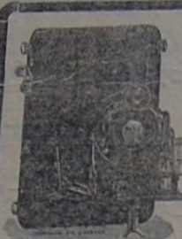
ФОТО ГРАФИЧЕСКІЙ СКЛАДЪ

Всѣ части, принадлежноты и шины. При магазинѣ образцовая мастерская.