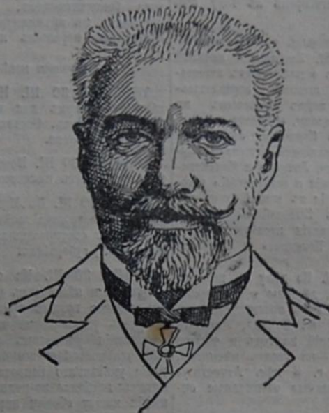
Начальникъ главнаго тюремнаго управленія, бывшій прокуроръ харьк. суд. палаты.