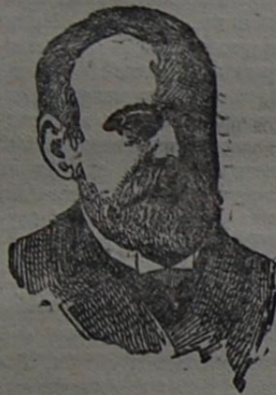
Д-ръ Шарль Бонкуръ.