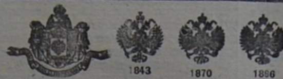
Парижъ 1900: Grand Prix.

Приданое отъ 100 р. до 10.000 р. и дороже.