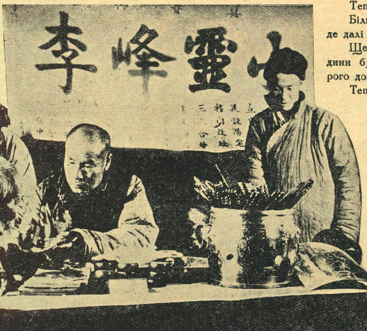
Скалки хінського побуту: Лікар-хіромант приймає клієнтів на шанхайській вулиці. Праворуч — хінський селянин.

нів. Найвидатнішим моментом хінського побуту є смерть, похорон і церемонії, з цим зв'язані.