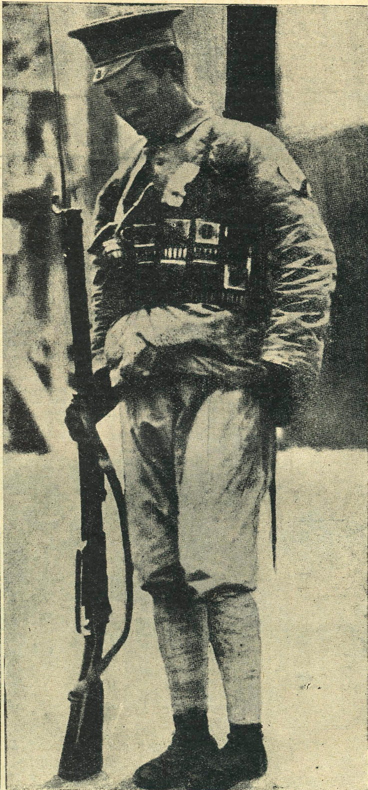
КАНТОНЕЦЬ У ПОХІДНІЙ ФОРМІ