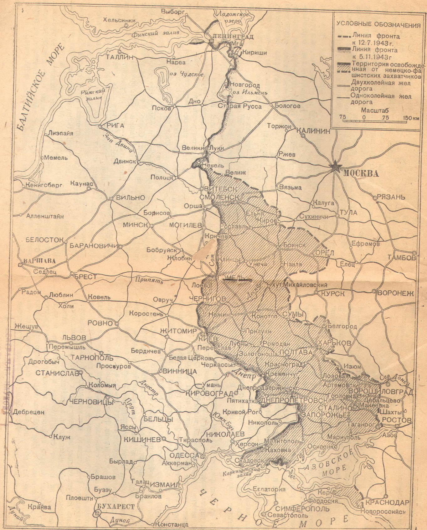
Размеры территории, освобожденной Красной Армией от немецкой оккупации за период с 12 июля по 5 ноября 1943 г.