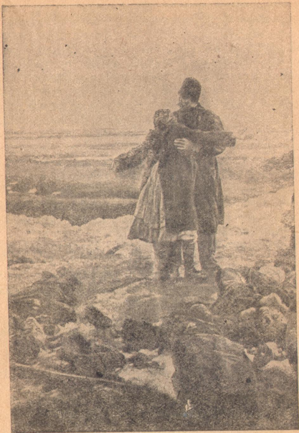
Отец и мать нашли тело сына