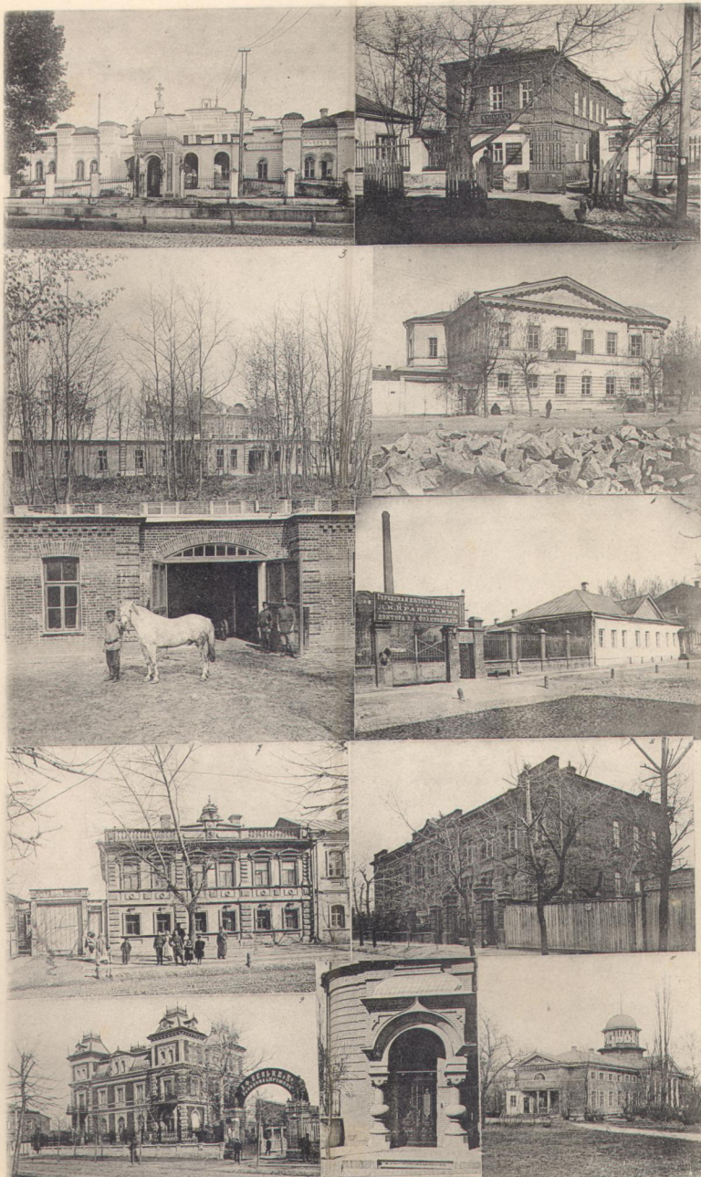
Больницы: 1. Александровская. 6. Дѣтская. Лѣчебницы: 2. Медицинскаго Общества. 4. Краснаго Креста. 7. Женщина-врач Дрентельнъ. 3. Одно изъ зданій Медицинскаго Общества (на Дачѣ), гдѣ приготавлиются врачебныя сыворотки. 5. Лошадь № 17 (Попъ), служившая для получения противодифтеритной сыворотки въ Институтъ Харьковскаго Медицинскаго Общества отъ 10 Мая 1897 г. до Апрѣля 1902 г. За это время было сдѣлано 42 кровопусканія и взято 294 литра крови, изъ которой было получено до 40000 лѣчебныхъ дозъ сыворотки. 8. Александровскій пріютъ. 9 и 10. Частныя зданія. 11. Барскій домъ на Основѣ (родина Г. Ф. Квитки-Основьяненко).