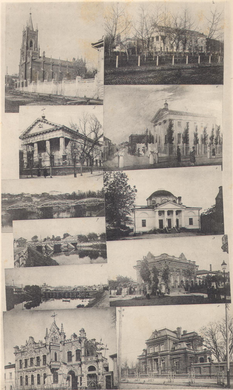
1. Костель. 2—4. Лютеранская кирха прежде и теперь. Мосты: 5. Вознесенский. 7. Маринский. 8. Прежний Харьковский. Синагоги: 6. Еврейская. 9. Карамская. 10 и 11. Частные здания.