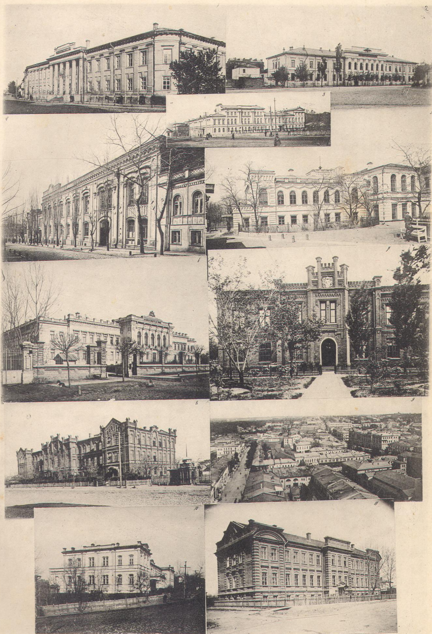
Гимназии: мужскія: 1. Первая. 2. Вторая. 4. Третья. 5. Четвертая. Гимназии женскія: 10. Первая (Маринская). 3. Вторая (Александровская). Училища: 8. Реальное. 6. Коммерческое. 7. Ремесленное. 11. Слѣбныхъ. 9. Видъ Харькова съ Соборной колокольни на Сумскую улицу.