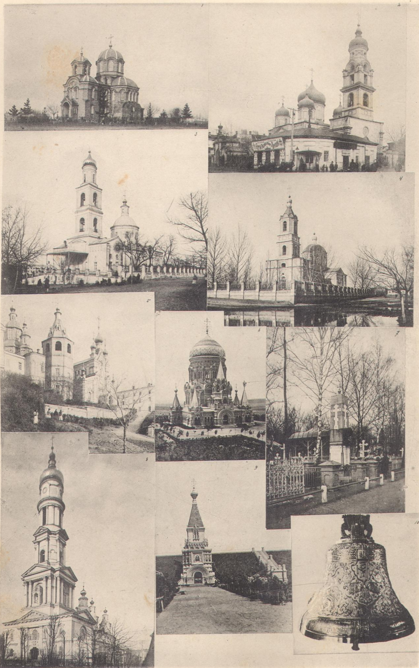
Церкви: 1. Кирилло-Мефодиевская. 2. Троицкая. 3. Михайловская. 4. На Ивановѣ. 5. Монастырь (съ Ключковской ул.). 6. Въ Боркахъ. 7. Памятникъ на городскомъ кладбищѣ надъ погибшими при крушеніи поезда въ Боркахъ. 8. Соборная колокольня. 9. Часовня въ Боркахъ. 10. Царскій колоколъ.