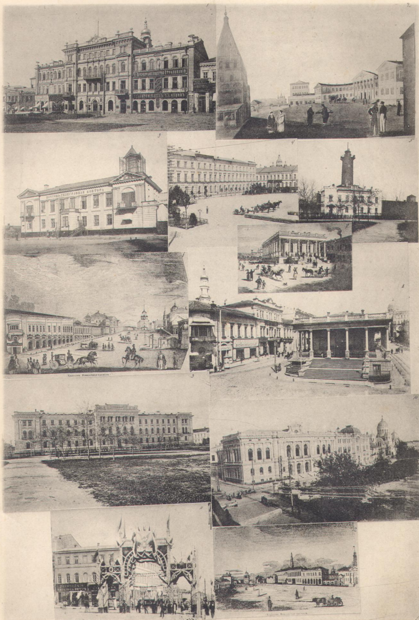
1. Городской домъ. 2. Прежнее здание Присутственныхъ мѣстъ и Соборной колокольни. 3. Почтово-Телеграфная Контора. 4. Присутственныя мѣста. 5. 1-я Полицейская часть. 6—8. Прежній и теперешній видъ мѣста, гдѣ Биржа. 9. Зданіе судебныхъ установлений. 10 и 12. Прежняя и теперешняя Николаевская площ. (отъ Сумской улицы). 11. Одно изъ украшеній на углу Московской ул. (во время празднествъ Коронаціи).